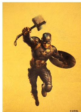
キャプテン・アメリカ