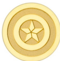
キャプテン・アメリカ