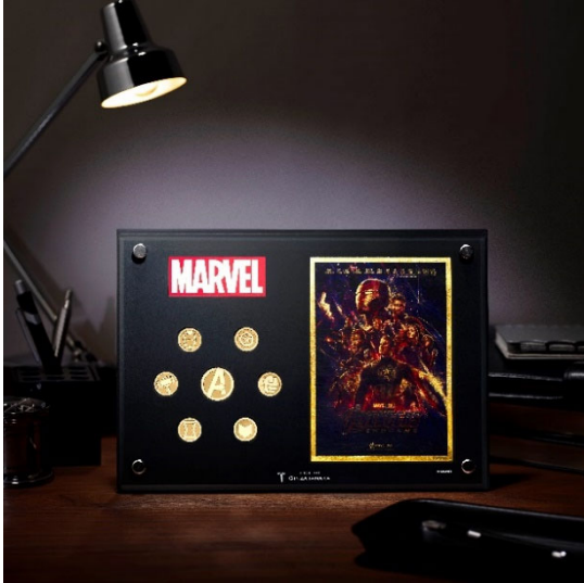
「マーベル アベンジャーズ／純金メダル フレーム付き」