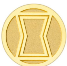
ブラック・ウィドウ