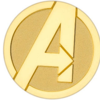
「マーベル アベンジャーズ／純金メダル フレーム付き」メダル部分