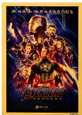
『アベンジャーズ／エンドゲーム』 ポスター

『アベンジャーズ／エンドゲーム』ポスター／アイアンマン／キャプテン・アメリカ／ 『アベンジャーズ／エンドゲーム』アイコンアート各 1 枚、計 4 種