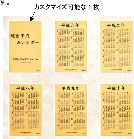
「純金平成ビッグカレンダー」左上部分

※商品価格(税込)・商品情報・店舗情報などは予告なく変更する場合がありますので、予めご了承ください。