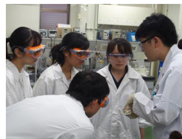
金めっき技術の説明

説を受けました。また、金やプラチナの地金（インゴット）を直に手に取り、普段あまり触れることのない貴金属を身近に感じることができる機会も設けられました。EEJAでは、電子顕微鏡を使ってめっきされた金の粒の観察、めっき液の製造ラインや、金めっきを施す工程の見学などを行い、産業用分野における貴金属やその技術への理解を深めました。