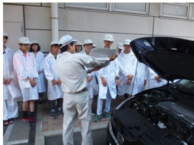
燃料電池自動車の解説