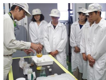
貴金属分析の見学

「夏休み 理系職場ツアーズ in TANAKA」では、参加者が田中貴金属グループで働く理系社員と交流を図りながら、彼らが働く職場を、実験などをまじえて見学しました。今回の見学先は湘南工場と日本エレクトロプレイティング・エンジニアーズ（以下EEJA）の二か所で、湘南工場では理系社員が実際に働いている貴金属の分析の現場、貴金属リサイクルの工程などを見学したほか、田中貴金属の技術が使用された燃料電池自動車の実車を使った解説を受けました。また、金やプラチナの地金（インゴット）を直