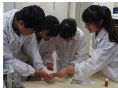
パラジウムとニッケルの板の違いを観察する参加者