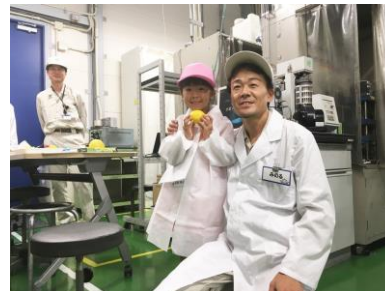
お父さんの職場を見学