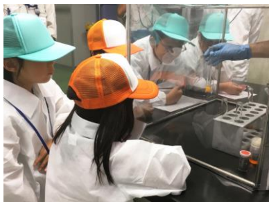
貴金属の分析実験の見学