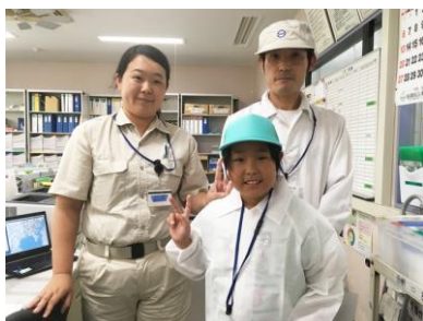
お母さんの職場を見学