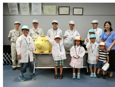
当社貴金属積立商品のキャラクター のキントン・プラトン（画像中央） との記念撮影