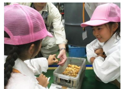
精製前の金の触感を確かめる

工場見学では、2班に分かれて参加者の家族が働く職場をまわりながら、金やプラチナなどの貴金属のリサイクル工程、貴金属の分析工程などの見学、金の地金（インゴット）を直にさわって、手触りや重さなどを体感する体験会などを行いました。